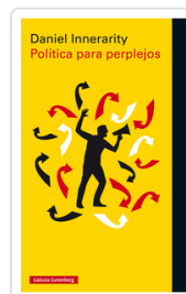
POLITICA PARA PERPLEJOS INNERARITY, DANIEL