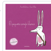
PEQUEÑO CONEJO BLANCO, EL BALLESTERO, EL BALLESTEROS, XOSE