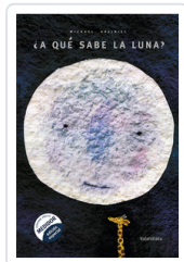
A QUE SABE LA LUNA? GREJNIEC, MICHAEL