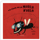
CASA DE LA MOSCA FOSCA, LA MEJUTO, EVA