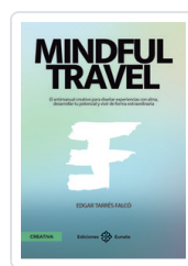
MINDFUL TRAVEL TARRES FALCO, EDGAR