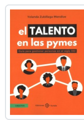
TALENTO EN LAS PYMES ZUBILLAGA MENDIVE, YOLANDA