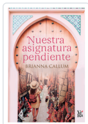
NUESTRA ASIGNATURA PENDIENTE CALLUM, BRIANNA