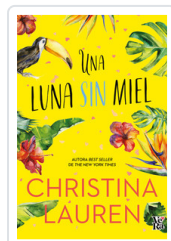
UNA LUNA SIN MIEL BILLINGS, LAUREN /HOBBS, CHRISTINA