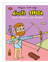
ANGEL SEFIJA PARA ACERTAR LOS CATORCE ENTRIALGO, MAURO