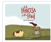
PRINCESA Y EL PONI BEATON, KATE