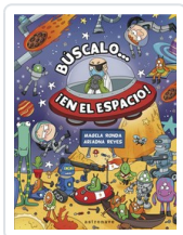
BUSCALO EN EL ESPACIO RONDA, MAGELA