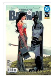
ABSOLUTE BATMAN, 2 AA.VV.