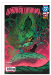
ABSOLUTE WONDER WOMAN, 2 AA.VV.