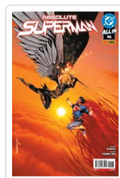
ABSOLUTE SUPERMAN, 2 AA.VV.