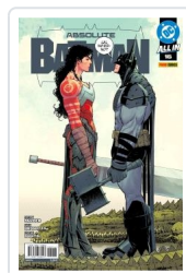
ABSOLUTE BATMAN, 2 AA.VV.