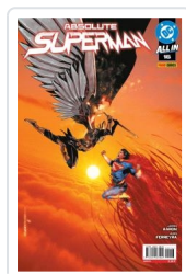
ABSOLUTE SUPERMAN, 2 AA.VV.