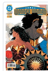
WONDER WOMAN, 3 AA.VV.