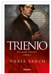
TRIENIO. EL SUENO LIBERAL SAUCH, NURIA