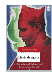
LLUVIA DE AGOSTO ALVAREZ, FRANCISCO