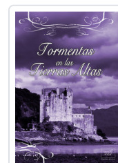
TORMENTAS EN LAS TIERRAS ALTAS COURTENAY, CRISTINA