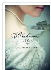
BLACKMOORE DONALDSON, JULIANNE