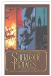
SHERLOCK HOLMES: JUICIO MOORE, LEAH