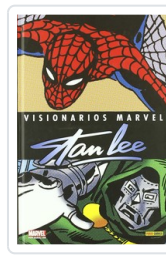
VISIONARIOS MARVEL: STAN LEE