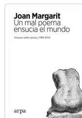
UN MAL POEMA ENSUCIA EL MUNDO MARGARIT, JOAN