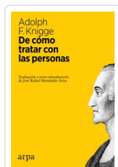
## DE COMO TRATAR CON PERSONAS KNGGE, ADOLPH