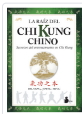
RAIZ DEL CHI KUNG CHINO YANG, JWING-MING