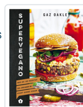
SUPERVEGANO OAKLEY, GAZ