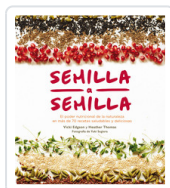
SEMILLA A SEMILLA HEATHER, THOMAS