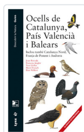
OCELLS DE CATALUNYA PAIS VALENCIA I BALEARS ESTRADA, JOAN