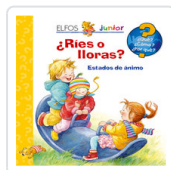
QUE JUNIOR. RIES O LLORAS VV.AA.