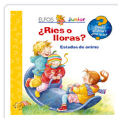
QUE JUNIOR. RIES O LLORAS VV.AA.