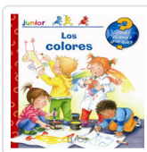
QUE JUNIOR. COLORES