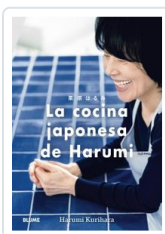
COCINA JAPONESA DE HARUMI, LA KURIHARA, HARUMI