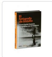
FOTOGRAFÍA DE BOLSILLO, EL KUS, MIKE