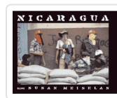
NICARAGUA MEISELAS, SUSAN