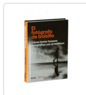
FOTOGRAFO DE BOLSILLO, EL KUS, MIKE