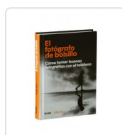
FOTOGRAFO DE BOLSILLO, EL KUS, MIKE