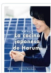
COCINA JAPONESA DE HARUMI, LA KURIHARA, HARUMI