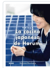
COCINA JAPONESA DE HARUMI, LA KURIHARA, HARUMI