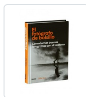
FOTOGRAFO DE BOLSILLO, EL KUS, MIKE