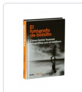
FOTOGRAFO DE BOLSILLO, EL KUS, MIKE