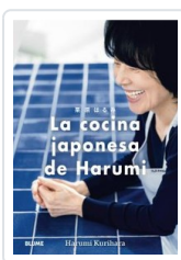
COCINA JAPONESA DE HARUMI, LA KURIHARA, HARUMI