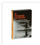
FOTOGRAFO DE BOLSILLO, EL KUS, MIKE