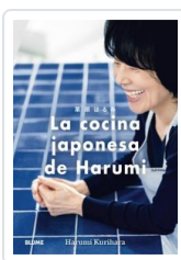
COCINA JAPONESA DE HARUMI, LA KURIHARA, HARUMI