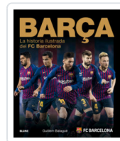
BARÇA (2018) BALAGUÉ, GUILLEM