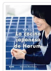
COCINA JAPONESA DE HARUMI, LA KURIHARA, HARUMI