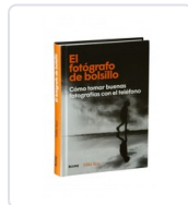
FOTOGRAFO DE BOLSILLO, EL KUS, MIKE