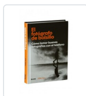
FOTOGRAFO DE BOLSILLO, EL KUS, MIKE