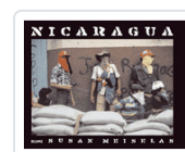
NICARAGUA MEISELAS, SUSAN