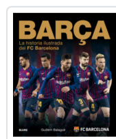
BARÁA (2018) BALAGUE, GUILLEM