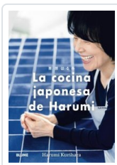
COCINA JAPONESA DE HARUMI, LA KURIHARA, HARUMI