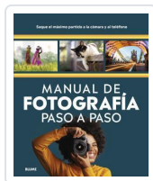
MANUAL DE FOTOGRAFIA PASO A PASO AA.VV.