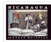
NICARAGUA MEISELAS, SUSAN