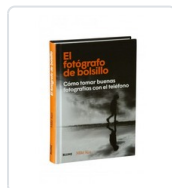
FOTOGRAFO DE BOLSILLO, EL KUS, MIKE