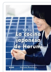
COCINA JAPONESA DE HARUMI, LA KURIHARA, HARUMI