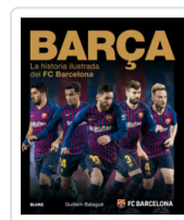
BARÇA (2018) BALAGUER, GUILLEM