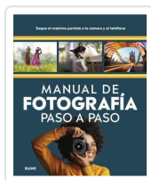
MANUAL DE FOTOGRAFIA PASO A PASO AA.VV.