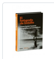
FOTOGRAFO DE BOLSILLO, EL KUS, MIKE