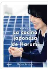
COCINA JAPONESA DE HARUMI, LA KURIHARA, HARUMI