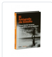
FOTOGRAFO DE BOLSILLO, EL KUS, MIKE