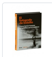
FOTOGRAFO DE BOLSILLO, EL KUS, MIKE