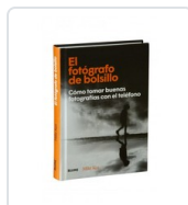
FOTOGRAFÍA DE BOLSILLO, EL KUS, MIKE