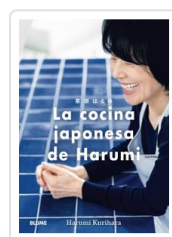
COCINA JAPONESA DE HARUMI, LA KURIHARA, HARUMI