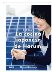
COCINA JAPONESA DE HARUMI, LA KURIHARA, HARUMI