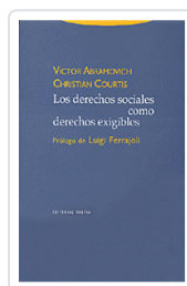
# DERECHOS SOCIALES COMO DERECHOS EXIGIBLES ABRAMOVICH, VICTOR