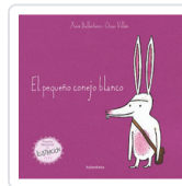
PEQUEÑO CONEJO BLANCO, EL BALLESTERO, XOSE BALLESTEROS, XOSE