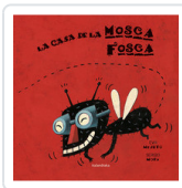
CASA DE LA MOSCA FOSCA, LA MEJUTO, EVA