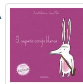
PEQUEÑO CONEJO BLANCO, EL BALLESTEROS, XOSE