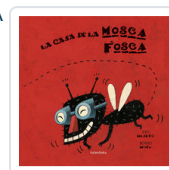
CASA DE LA MOSCA FOSCA, LA MEJUTO, EVA