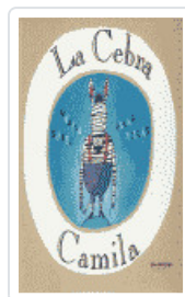
CEBRA CAMILA, LA NUÑEZ/ VILLAN