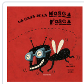
CASA DE LA MOSCA FOSCA, LA MEJUTO, EVA