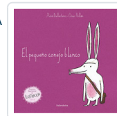
PEQUEÑO CONEJO BLANCO, EL BALLESTEROS, XOSE