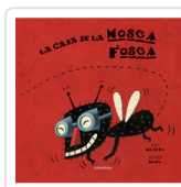
CASA DE LA MOSCA FOSCA, LA MEJUTO, EVA