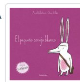
PEQUEÑO CONEJO BLANCO, EL BALLESTERO, XOSE